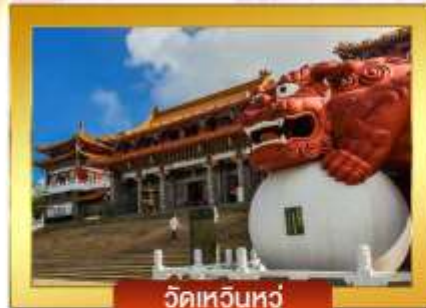
วัดเหวินหลู่