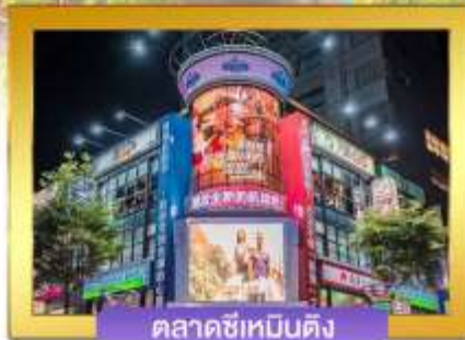
ตลาดซีเหมินติง