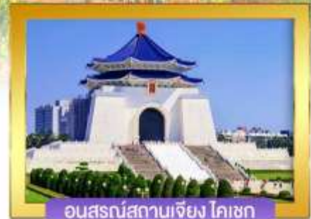
อนุสรณ์สถานเจียง ไคเชก