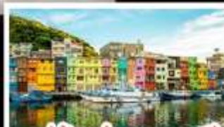
หมู่บ้านประมงหลากสี