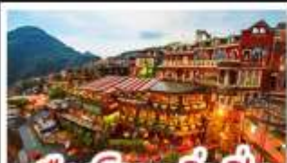
เมืองโบราณจิวเฟิ่น

ฟาร์มแกะชิงจิง - ทะเลสาบสวี่นจินตรา จิวเฟิ่น - หมู่บ้านประมงหลากสี - ไทเป 101 หมู่บ้านสายรุ้ง - ตลาดล่าหูก & ซีเหมินติง ปลาประ-ธานธิบดี - เขียวหลงเป่า