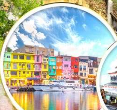
ท่าเรือสายรุ้ง