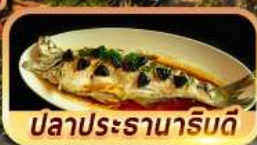
ปลาประรานาภิรมดี