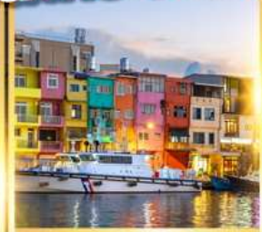
ท่าเรือประมงเจิ้งปิง