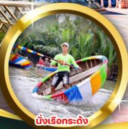
นั่งเรือกระดิ่ง