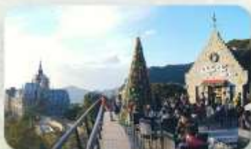
Gio Cafe Tam Dao