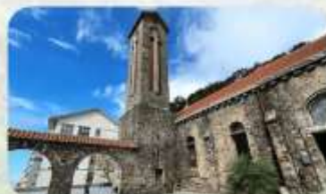
Tam Dao Stone Church