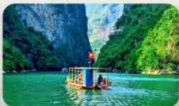
ล่องเรือ Ma Pi Leng Pass

YEN BIEN LUXURY 4* หรือเทียบเท่ามาตรฐานเวียดนาม