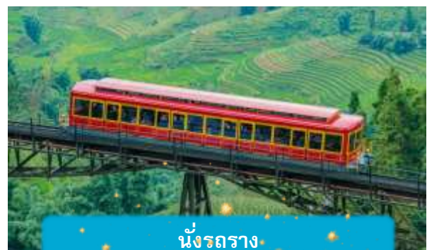
นั่งรถราง

เที่ยง บริการอาหารกลางวัน ณ ภัตตาคาร พิเศษ ... เมนูบุฟเฟ่ฟานซีปัน