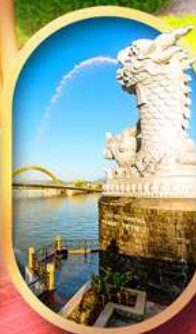
คาร์พดราท้อน