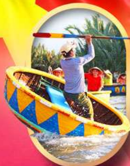
ล่องเรือกระดังง์