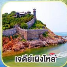
เจดีย์เฝิงไหล