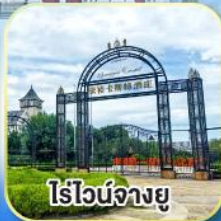
ไร์ไวน์จางยู