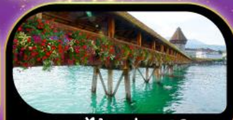
สะพานไม้ชาเปล คุชชิน