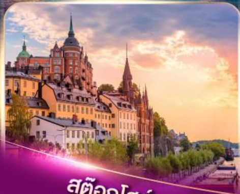
สต็อกโฮล์ม เวนิสแห่งยุโรปเหนือ