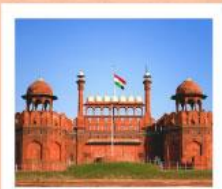
♥♦♦ Agra Fort