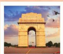
♥♦♦ India Gate