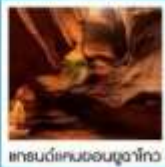
แกรนด์แคนยอนยูลูฉาโกว