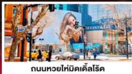
ถนนหยอไห่มีดเคิลโรด