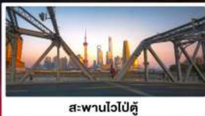
สะพานไวปี้ตู่