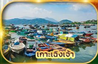
เกาะเจิงเจ้า