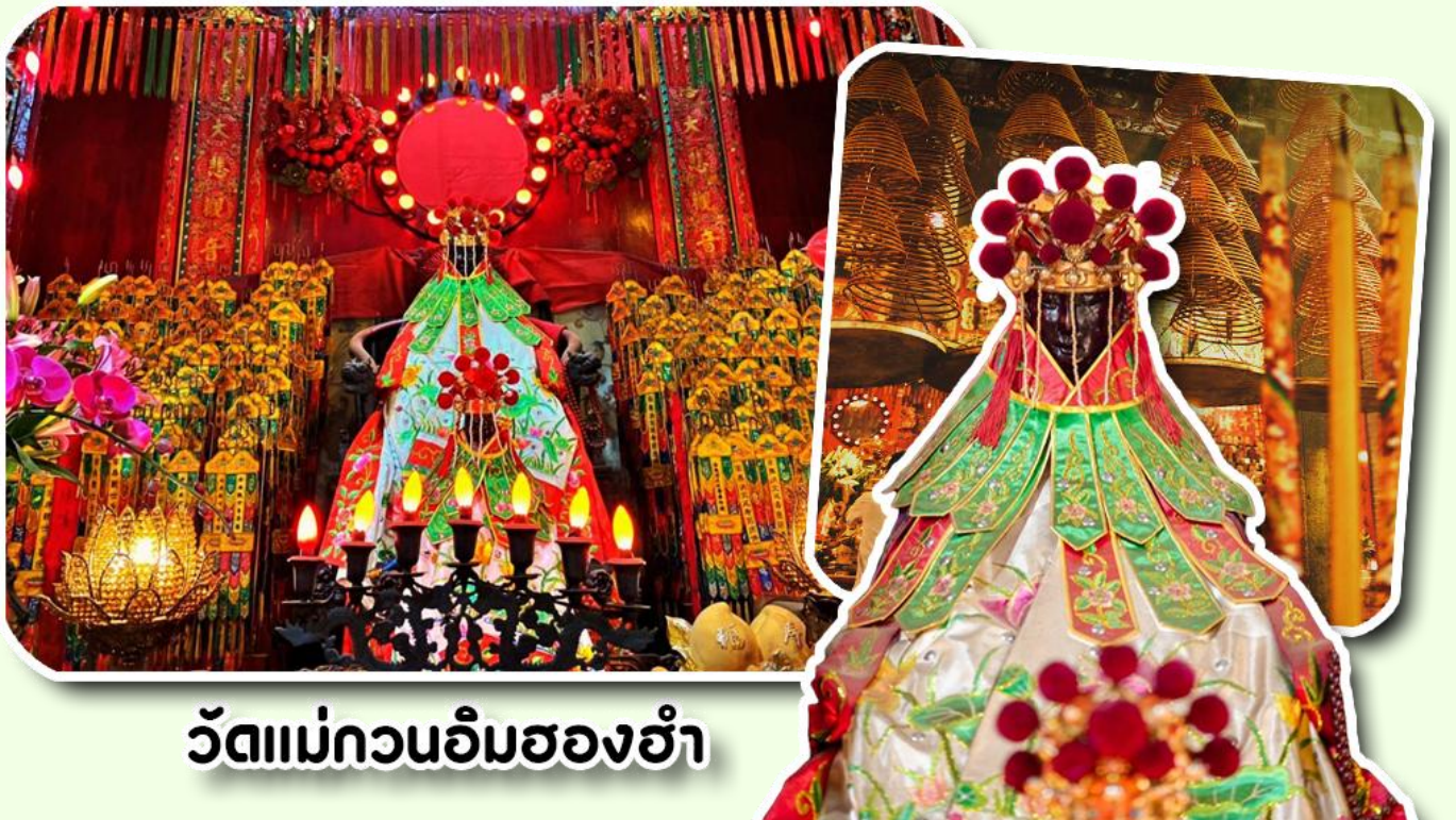
วัดแม่กวนอิมสองฮำ

ฮ่องกงสร้างตั้งแต่ปี ค.ศ .1873 เป็นวัดขนาดเล็กที่มีชาวฮ่องกงศรัทธานับถือกันเป็นอย่างมากวัดแห่งนี้เป็นที่ ประดิษฐาน องค์เจ้าแม่กวนอิมสองฮำ ที่มีชื่อเสียงเรื่องการให้กู้ยืมเงินเชื่อกันว่าท่านช่วยพลิกฟื้นเศรษฐกิจของชาวฮ่องกง ผู้คนจึงนิยมมาเยี่ยมเงินทำธุรกิจจนสำเร็จร่ำรวย รุ่งเรืองโดยให้ท่านอธิษฐานขอพรต่อหน้า เจ้าแม่กวนอิมสองฮำพร้อมกับระบุ วันเวลาในการขอพรด้วย จากนั้นนำธนบัตรตามฐานะและศรัทธาที่เราจะนำเป็นสื่อในการขอพร เขียนจำนวนเงินที่ต้องการ ลงไปด้วย ใส่สกุลเงินยิ่งใหญ่ แล้วนำเงินใส่ในซองแดง ควรเตรียมซองแดงไปเอง นำซองแดงไปวนรอบกระถางรูป วนขวา จำนวน 3 ครั้ง แล้วเก็บซองแดงในกระเป๋าสตางค์ เป็นเงินขวัญถุง ถ้าประสบความสำเร็จตามที่มุ่งหวัง ให้นำเงินในซองแดง ทำบุญหยอดตู้ที่วัดแห่งนี้ในโอกาสต่อไป