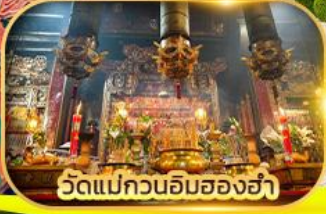
วัดแม่กวนอิมสองฮ่า