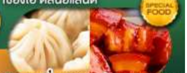
พิเศษ เสี่ยวหลงเป่า หมูดงพอ เดินทาง ม.ค. - มิ.ย. 69