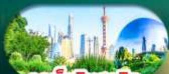
จุดเช็กอินสุดฮิต North Bund Shanghai

เซี่ยงไฮ้ หางโจว ล่องทะเลสาบซีหู ฟรีเดย์