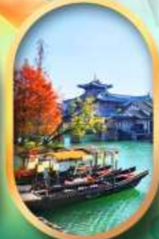
เมืองโบราณผู้หยวน