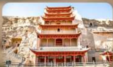
กำม่อเกาคู