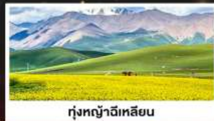
ทุ่งหญ้าฉีเหลียน