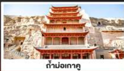
ถ้ำม่อเกาตุ