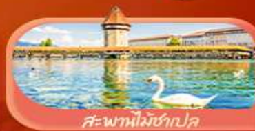
สะพานไม้ซังปก

Highlight เยือนหมู่บ้านแสนสวยเซอร์แมท เช็กอินศาลาไทยสุดงามที่โลซาน เที่ยวลูเซิร์น ชมสะพานไม้ซังและอนุสาวรีย์สิงโต ซาลี แอปสทิน ชมประติมากรรม The Fork และปราสาทซิลลองริมทะเลสาบ เยือนมิลาน มหาวิหารดูโอโม เกี้ยวเวนิส เมืองลอยน้ำสุดโรแมนติก อินกับรักอมตะที่บ้านจูเลียต และช้อปปิ้งจุใจที่ Serravalle Outlet