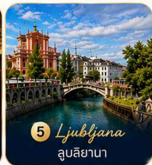
5 Ljubljana ลูบลิยานา