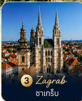
3 Zagreb ซาเกร็บ