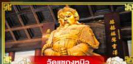
วัดเขangkม็ว