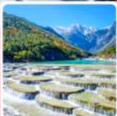
ทะเลสาบโป้สุ่ยเหอ