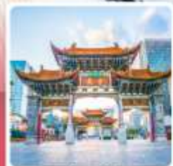
ประตูน้ำทงโก่หยก