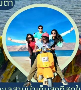
ทะเลสาบน้ำเค็มสูงที่สุดในโลก แปงกอง