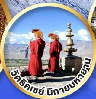
วัดริคเซย์ นิกายมหายาน