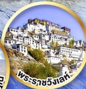
พระธาตวง์เลห์