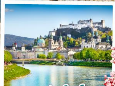
ซาลซ์บวร์ก