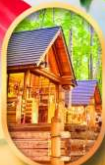
บึงเกิลเกอโรส