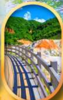
โนโบริเบทส์