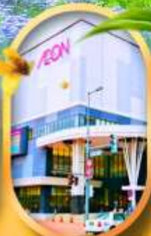
อ็อนมอลล์