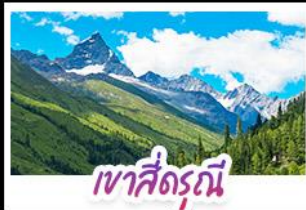
เขาสี่ธรณี