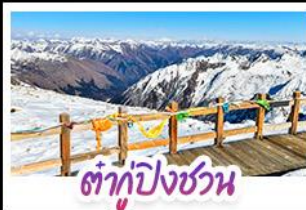
ต้ากูปังชวอน