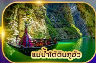
แม่น้ำใต้ดินกุ้ยโจว