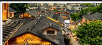
เมืองโบราณสือปาตี