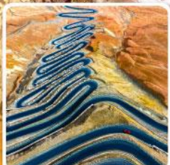
ถนนผานหลงกู่ต้าว