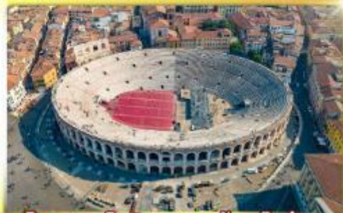
โรงละครโรมันกลางจัหวโรม่า