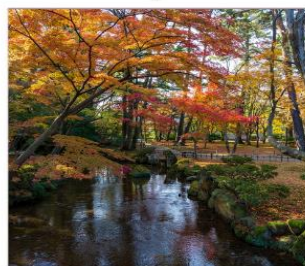
สวนเคนโระคุเอ็น