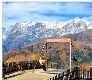
ฮาคุบะอิวาทาเกะ