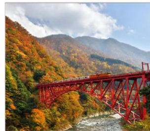
รถไฟชมวิวจุมนเงาคูโรเนะ