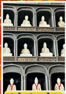
วัดโดชิซังเซอิโดจิ