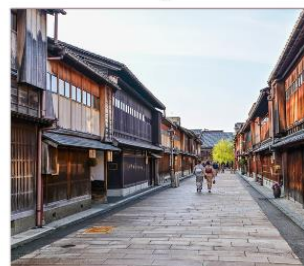
ย่านโรงน้ำชาอิงาชิบายะ