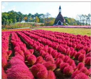
สวนดอกไม้ไม้กกระโนะซาโตะ