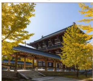
วัดไดชิซังเซอิโดจิ