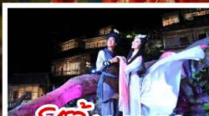
ซีวี่จิ้งจอกขาว