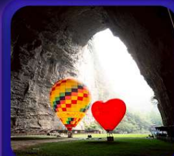
“ ถ้าถึงหลง ”

T2G-CKG29FD ลงชิง เอ็นจื่อ...ถ้าถึงหลง ล่องเรือมังกรกังสุ่ย ผิงซานแกรนด์แคนยอน 5D 4N (FD)