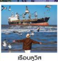
เรือบลูอิส