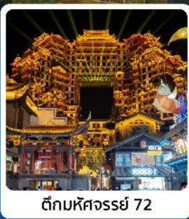
ตึกหอคจรรย 72