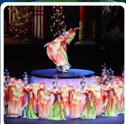
โชว์ FOSHAN QIANGUQING