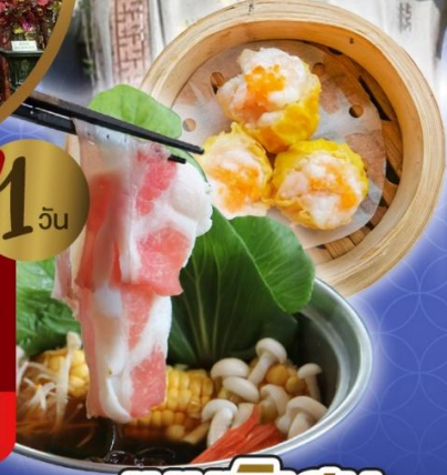
เจ้าแม่กวนอิม ริพลัสเบย์