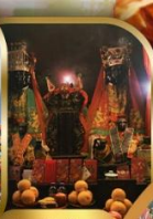
วัดผานไหว