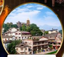
เมืองโบราณฉีโจว