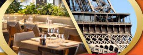
รับประทานอาหารกลางวัน บนหอไอเฟล