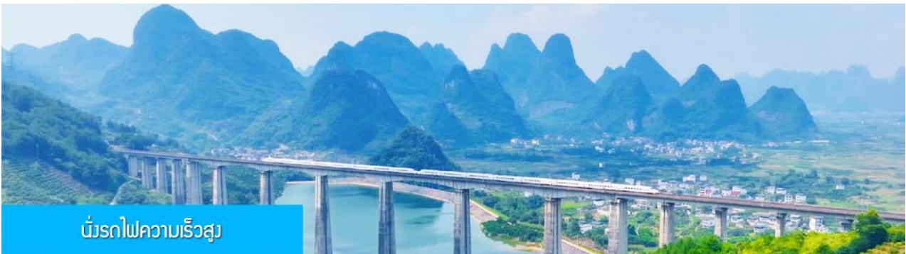
นั้รถไฟความเร็วสูง

หลังอาหารเช้าท่านเดินทางสู่สถานีรถไฟความเร็วสูง นครกวางเจา