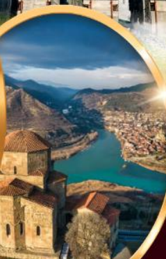
อารามจวารี

ทบิลีซี มิกสเคต้า คาซเบกกี กูดาอูรี กอริ อพลิสต์ซิเคห์ คูไตซี บากูมิ