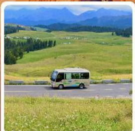
ทุ่งหญ้าเจียนปูลาเค่อ