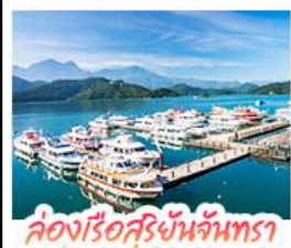
ล่องเรือสุริยจันทร์เถา