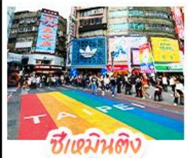
ซีเหมินต้ง