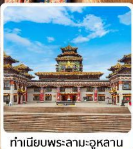
ทำเนียบพระลามะอูหลาน