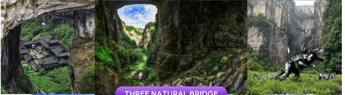
THREE NATURAL BRIDGE