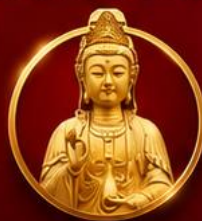
รับพลังบารมีเจ้าแม่มาจู่