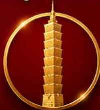
เสริมดวงเศรษฐี