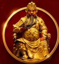
ขอพรเทพเจ้ากวนอู

เปิดดวงเศรษฐี เสริมดวงจួយี่ใต้หวัน ขอพรเทพกวนอู รับพลังบารมีเจ้าแม่มาจู่ 4 วัน 3 คืน