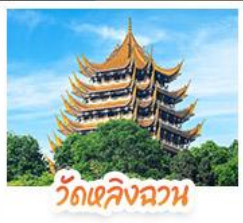
วัดเลิ่งฉวน