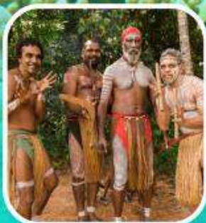
Rainforestation Aboriginal Show