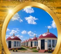
ที่พักโตลกีระโฮม