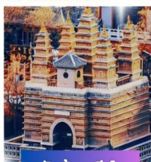
วัดห้าเจดีย์