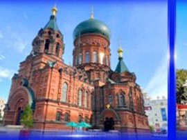
โบสถ์เซนต์ไอแซค