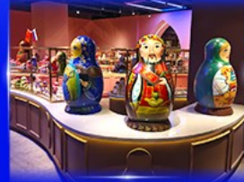
พิพิธภัณฑ์ ตุ๊กตาแม่ลูกดก