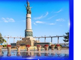
อนุสาวรีย์มังกร